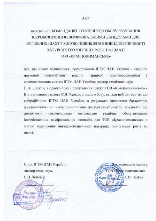
Рисунок 2 – Акт передачі на шахту ДП ВК «Краснолиманська» у 2020 році

Матеріали науково-дослідницької роботи по підвищенню вибухобезпеки для вугільних шахт розробленої в рамках ГБ 71 доктором технічних наук Лопатиним В.В. передані в 2020 році по акту (Рис.2) на шахту ДП ВК «Краснолиманська» у вигляді «Рекомендацій з технічного обслуговування іскробезпечними вимірювальними ланцюгами для вугільних шахт з метою підвищення викидобезпечності натурних геологічних робіт на шахті ТОВ «Краснолиманське» з метою підвищення викидобезпечності при проведенні натурних геологічних робіт з вимірювальною апаратурою.