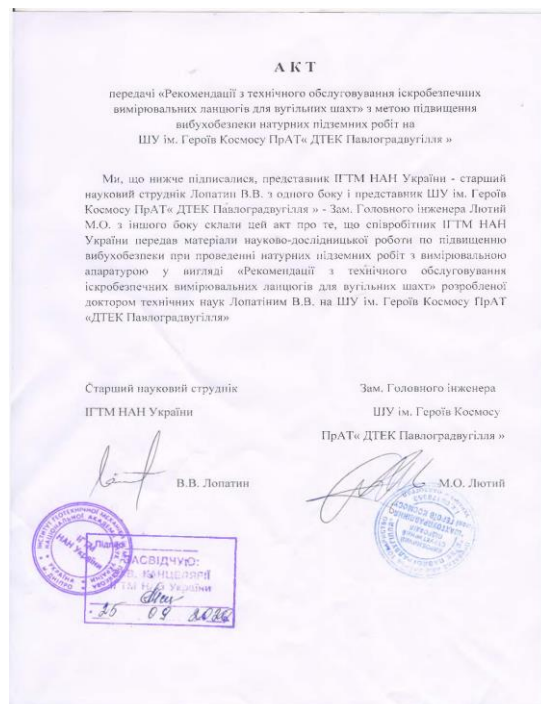
Рисунок 3 – Акт передачі на ШУ ім. Героїв Космосу ПрАТ «ДТЕК Павлоградвугілля» у 2021 році