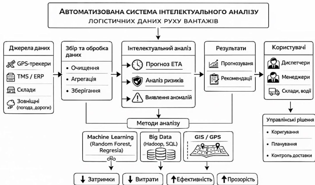
Рисунок 1 – Автоматизована система

аналіз і прогнозування логістичних даних у єдиному інформаційному середовищі, залишається недостатньо опрацьованим. Це зумовлює актуальність подальших досліджень, спрямованих на розроблення інтегрованих автоматизованих систем інтелектуального аналізу логістичних даних руху вантажів, орієнтованих на практичне використання в сучасних транспортно-логістичних мережах [2, 12, 13].